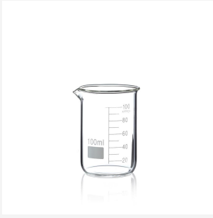
Becherglas - niedrige Form, hitzebeständig, 100 ml