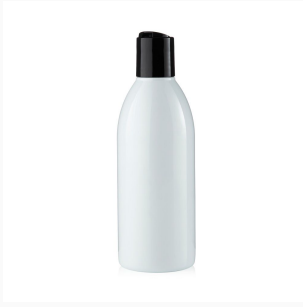
Flasche R-PET weiß mit schwarzem Disc Top, 250 ml