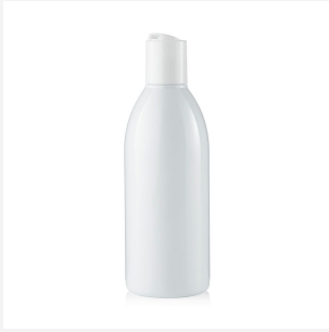
Flasche R-PET weiß mit weißem Disc Top, 250 ml