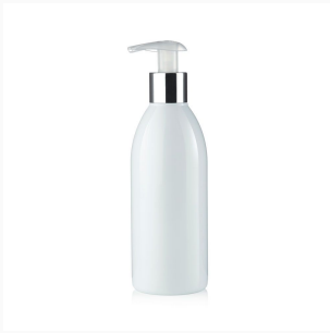
Flasche R-PET weiß mit Silberrand und weißer Lotionpumpe, 250 ml