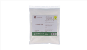
Tegomuls, 100 g