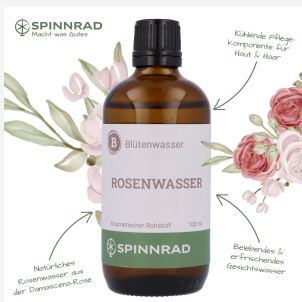
Rosenwasser, 100 ml