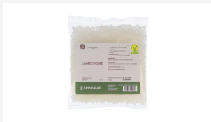
Lamecreme, 100 g