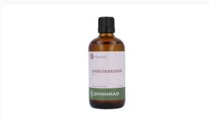
Aprikosenkernöl raffiniert, 100 ml