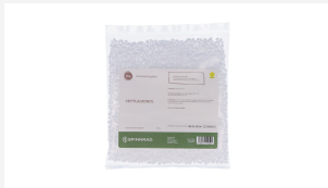
Cetylalkohol, 50 g